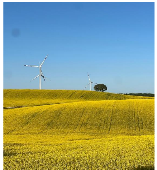
Vertragsanbau von Bio-Raps in Italien

Die Rapsernte wird ab Juli erwartet. Erstes Öl aus neuer Ernte wird ab August/September verfügbar sein.